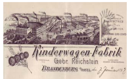
Los 042 Ausruf: 10 €

Hs. Brief auf illu. Briefbogen mit großer Abb. der Fabrikanlage, Medaillen und Blumenranken. Format: 22x28,5. Knickfalten. (E016)