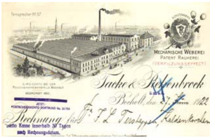
Los 033 Ausruf: 10 €