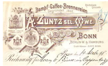
Los 038 Ausruf: 12 €

Alte Rechnung mit Abb. unterschiedlicher Leistungs-Medaillen und Wappen. Format: 22x28. Knickfalten, kleinere Abheftlochung. Zusätzlicher Vermerk angeklebt. (E016)