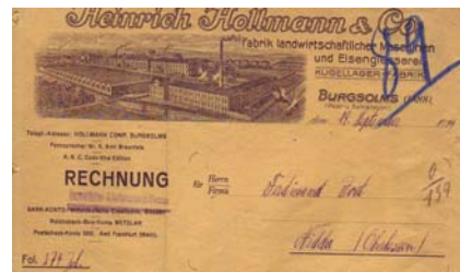
Abb. der Fabrikanlage. Format: 22,5x28,5. Knickfalten, fleckig, kleinere Abheftfaltung. (E016)