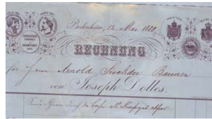
Los 037 Ausruf: 12 €

Alte Rechnung mit Abb. unterschiedlicher Leistungs-Medaillen. Format: 22x28. Knickfalten, oberer Rand fleckig. Gedruckt auf blauem Papier. (E016)