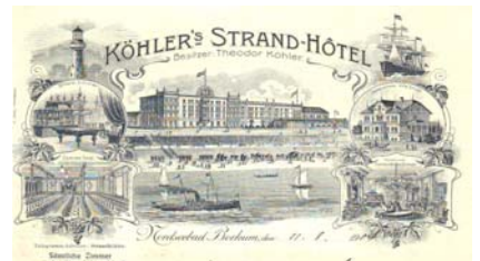
Los 041 Ausruf: 18 €

Dekorativer Briefbogen mit handschriftlichem Text, mit Abb. des Hotels, Leuchtturm, Segelschiff, Teilansichten der Dépendance Villa Emilie, Musik- und Conversations-Zimmer, Speise-Saal und Billard-Zimmer. Die Abb. nehmen mehr als 1/3 des Blattes ein. Format: 22x29. Knickfalten, Randeinrisse, leicht fleckig. (E001)