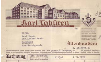
Abb. der Fabrik-Marke und Geschäftshaus. Format: 21x29,5. Knickfalten, Abheftlochung. Wasserzeichenpapier: F 1875. (E016)