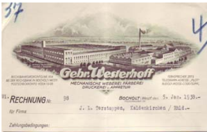
Los 035 Ausruf: 12 €

Rechnung an eine Firma in Kaldenkirchen / Rhld. mit Abb. der Fabrik-Anlage. Format: 21x29. Knickfalten, Abheftlochungen. (E016)