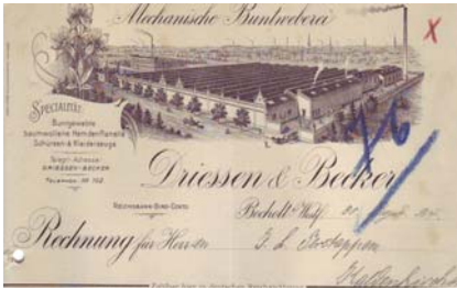
Los 034 Ausruf: 10 €

mit Abb. der Fabrik-Anlage. Format: 20,5x28. Knickfalten, Abheftlochungen. (E016)