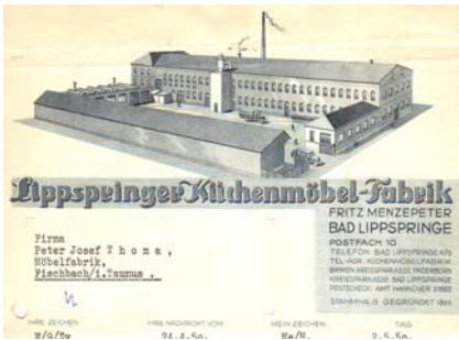
Abb. der Fabrik-Anlage. Format: 21x29. Knickfalten, Abheftfaltungen, kleiner Randeinriss oben. (E016)

Bad Lippspringe, 1950: Lippspringer Küchenmöbel-Fabrik Fritz Menzepeter