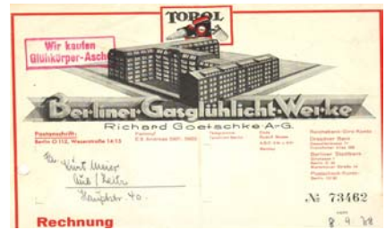
Abb. der Fabrik-Anlagen, Markenzeichen. Format: 22x28,5. Knickfalten, Abheftfaltungen, gering fleckig. (E016)

Los 015 Ausruf: 10 € Bergneustadt, 1951: Leop. Krawinkel, Wirk- und Strickwarenfabrik - Spinnerei