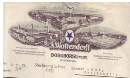
Los 039 Ausruf: 10 €

Rechnung mit drei Abb. von Fabrik-Anlagen (Borghorst, Nordwalde, Rasenbleiche), Schutzmarke. Format: 22x28,5. Knickfalten, Abheftlochung. (E016)