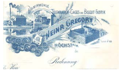
Los 180 Ausruf: 12 €

Blanko-Firmenrechnung mit Abb. der Fabrikanlage, Geschäftshäuser, diverse Ausstellungsmedaillen. Format: 22x28,5. Knickfalten, Abheftlochung am oberen Blattrand. (E016)