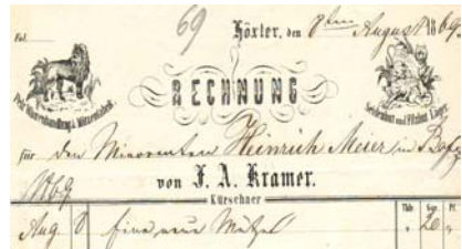
Los 185 Ausruf: 14 €

Kleinformat, mit Abb. von Schutzmarken Raubtiere. Format: 16,5x21. Knickfalten, leicht fleckig. (E016)