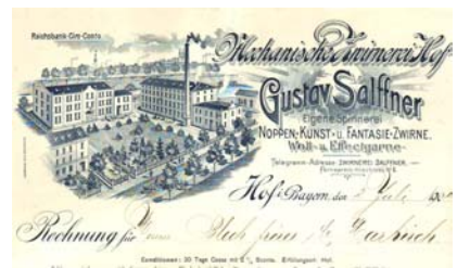
Los 182 Ausruf: 12 €

mit Abb. der Fabrikanlage, davor Straßenfront. Format: 21x28,5. Knickfalten, leicht fleckig. (E016)