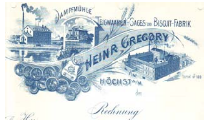
Los 181 Ausruf: 12 €

Blanko-Firmenrechnung mit Abb. der Fabrikanlage, Geschäftshäuser, diverse Ausstellungsmedaillen. Format: 21x29,5. Knickfalten, Abheftlochung oben, kleinere Entwertungsschnitte. (E001)