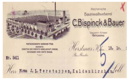
Los 184 Ausruf: 22 €

mit Abb. der Fabrikanlage. Format: 21x28,5. Knickfalten, leicht fleckig, Abheftlochung. (E016)