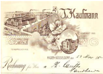
Los 177 Ausruf: 10 €

mit Abb. des Kaufhauses, der Lagerhäuser, Blumenumrandung. Format: 20,5x28. Knickfalten, Abheftlochung, leicht fleckig. (E015)