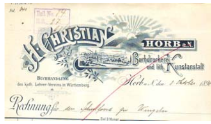
Los 183 Ausruf: 10 €

mit Abb. der Fabrikanlage, Blumen. Format: 21x32,5. Knickfalten, leicht fleckig. (E016)