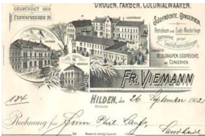
Los 176 Ausruf: 11 €

Hilden/Düsseldorf, 1902: J. Kaufmann, Colonialwaaren