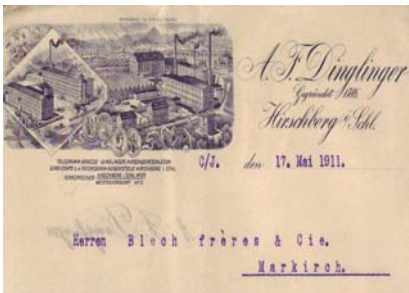
Los 178 Ausruf: 12 €

Brief mit Abb. der Fabrikanlage. Format: 21x28,5. Knickfalten, leicht fleckig. (E016)