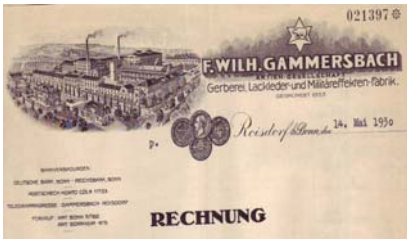
Los 298 Ausruf: 13 €