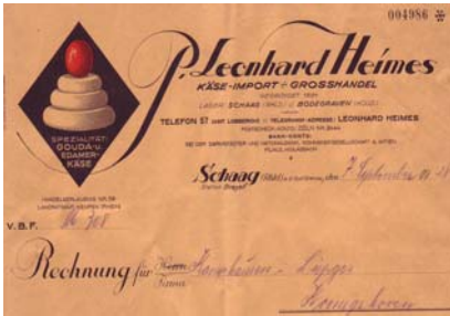
Los 309 Ausruf: 10 €

Firmenrechnung mit Abb. von versch. Käsesorten. Format: 21,5x28. Knickfalten, kleine Fehlstelle am oberen linken Blattrand. (E001)