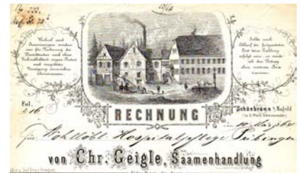
Los 317 Ausruf: 10 €

mit Abb. der Fabrikanlage. Format: 20,5x31. Knickfalten, leicht fleckig. (E016)