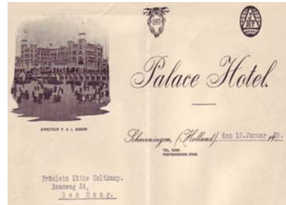
Los 312 Ausruf: 12 €

Anschreiben mit Abb. des Hotelkomplexes, davor Strandkörbe. Weiterhin zwei Mitgliedszeichen von Hotelvereinigungen. 13.1.1929. Format: 21,5x27,5. Knickfalten, kleine Papierverletzungen linker Rand. (E001)