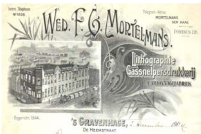
Los 300 Ausruf: 10 €

Factura der Fa. Wed. F.G. Mortelmans, mit Abb. des Geschäftshauses, davor Dampfzug. Format: 21,5x28. Knickfalten, kleines Fehlstück linke obere Ecke. (E001)