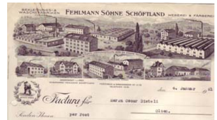
Los 316 Ausruf: 14 €

Factura der Bekleidungs- & Wäschefabriken, Weberei & Färberei Fehlmann Söhne. Dated: 6.1.1921. Abb. der Schutz-Marke (ringende Männer) und 5 verschiedene Ansichten von Fabrikgebäuden bzw. Geschäftshäusern. Format: 22x28,5. Abheftfaltung, Rostspur von Heftklammer am oberen Blattrand. (E001)