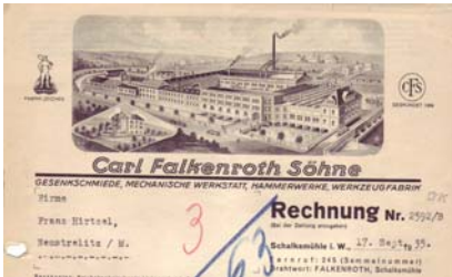
Los 310 Ausruf: 14 €

mit Abb. der Fabrikanlage, Fabrik-Zeichen. Format: 22x28,5. Knickfalten, leicht fleckig, Abheftfaltung. (E016)