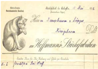
Los 308 Ausruf: 10 €