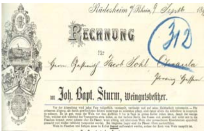
Los 299 Ausruf: 10 €

Doppelblatt mit Abb. von Wappen, Medaillen und kleiner Landschaftsansicht. Format: 22,5x28. Knickfalten, leicht fleckig, Abheftfaltung. (E016)