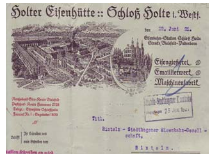
Los 313 Ausruf: 10 €

Brief an die Rinteln-Stadthagener Eisenbahn-Gesellschaft mit Abb. der Fabrikanlage, Geschäftshaus. Format: 22x28,5. Knickfalten, leicht fleckig, Rückseite mit Rostspur von Heftklammer. (E016)