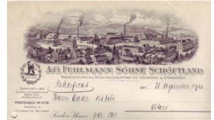
Los 315 Ausruf: 13 €

Firmenrechnung der A.G. Fehlmann Söhne Bekleidungs- Wäscheindustrie, Weberei & Färberei. 28.12.1920. Abb. der Schutz-Marke, sowie der Fabrikanlagen in Schöffland, Birrwil und Veltheim. Format: 21,5x28. Abheftfaltung, gering fleckig. (E001)