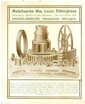
Los 1119 Ausruf: 10 €

s.w. Werbekarte in franz. Sprache mit Abb. von verschiedenen Produkten, teilweise Golddruck. Knickfalten, fleckig. Format: 15x12. (E024)