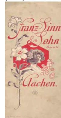
Los 1125 Ausruf: 15 €

Dekorative Jugendstil- Einladungskarte zum Besuch der neuen Kollektion. Auch die beiden Innenseiten mit Jugendstielelementen. Deckblätter leicht angeschmutzt. Format: 8x18. (E033)