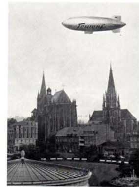
Los 1124 Ausruf: 25 €

Doppelseitige Glückwunschkarte zu Weihnachten und Neujahr der Geschäftsleitung und des Betriebsrates Leonard Monheim Schokoladenfabrik GmbH. Format: 11,5x17,5. (E033)