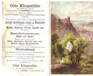
Los 1121 Ausruf: 20 €

Drei Bilder aus deutschen Landen: Mittelrhein, Heidelberg, Berchtesgaden; rückseitig jeweils die Werbung. Angeschmutzt, ein Bild mit Eckabrissen. Format: 8,5x13. (E030)