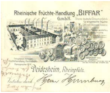
Los 1118 Ausruf: 10 €

Hohenlimbourg: Metallwerke Ww. Louis Ebbinghaus, ca. 1900