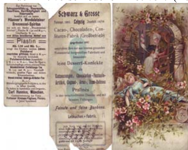
Los 1120 Ausruf: 10 €

Drei unterschiedlich große, teils beschädigt Bilder mit verschiedenen Motiven. (E030)