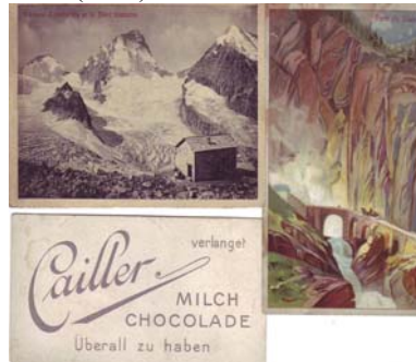
Los 1122 Ausruf: 15 €

15 fotografische Ansichten aus der Schweiz, drei mit gezeichneten Motiven. Format: i.a. 11x7. (E030)