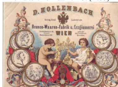
Los 1123 Ausruf: 20 €

Dekorative, farbige Karte der Fabrik für Bronzewaren und Erzgießerei. Abbildung von Medaillen und Orden, zwei Puten, die Gegenstände der Firma präsentieren. Knickfalten. Format: 17x13. (E033)